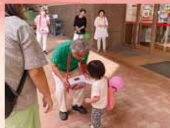
ヨシヅヤ津島本店 街頭募金

市民のみなさまはじめ、ボランティア団体、各事業主および 各機関にご協力いただきました「赤い羽根共同募金運動」につ きまして、このとおりご報告いたします。温かいご協力、心より 御礼申し上げます。