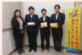
愛知県立津島高等学校