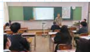
津島北翔高 10月31日(金)・11月7日(金)