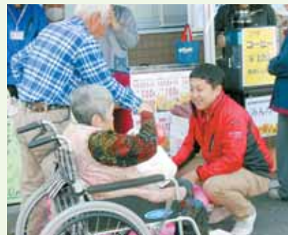
津島市障がい者総合支援協議会 事務局