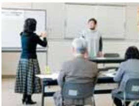
あゆみ・かたくり