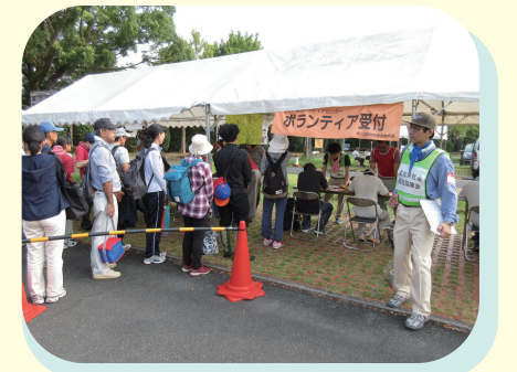
大規模災害時のボランティア活動支援