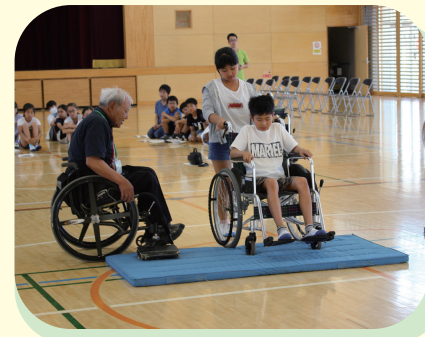
学校での福祉教育