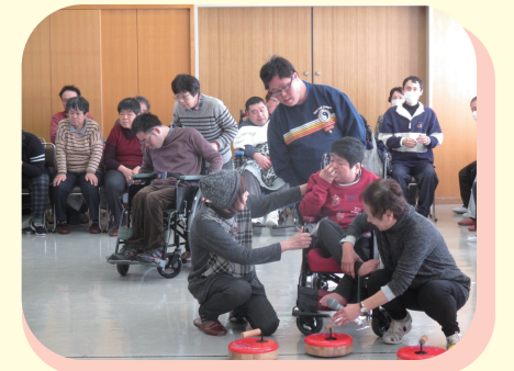
障がいのある方のために