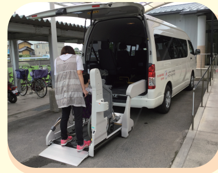
福祉施設の車両整備

赤い羽根共同募金は、高齢者、障がい者、子どもたちへの地域の福祉活動を支援する募金です。災害時には、被災地支援にも役立っています。