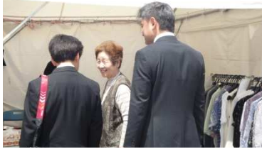
ボランティアさんが笑顔で種中！！！！

藤まつりへお越しの際は、是非津島市障がい者総合支援協議会のブースにお立ち寄りください♪