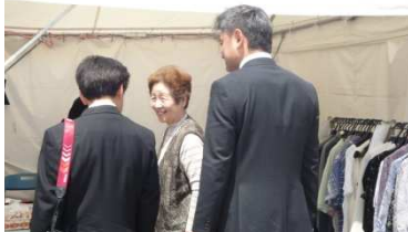
ボランティアさんが笑顔で種中！！！！

藤まつりへお越しの際は、是非津島市障がい者総合支援協議会のブースにお立ち寄りください♪